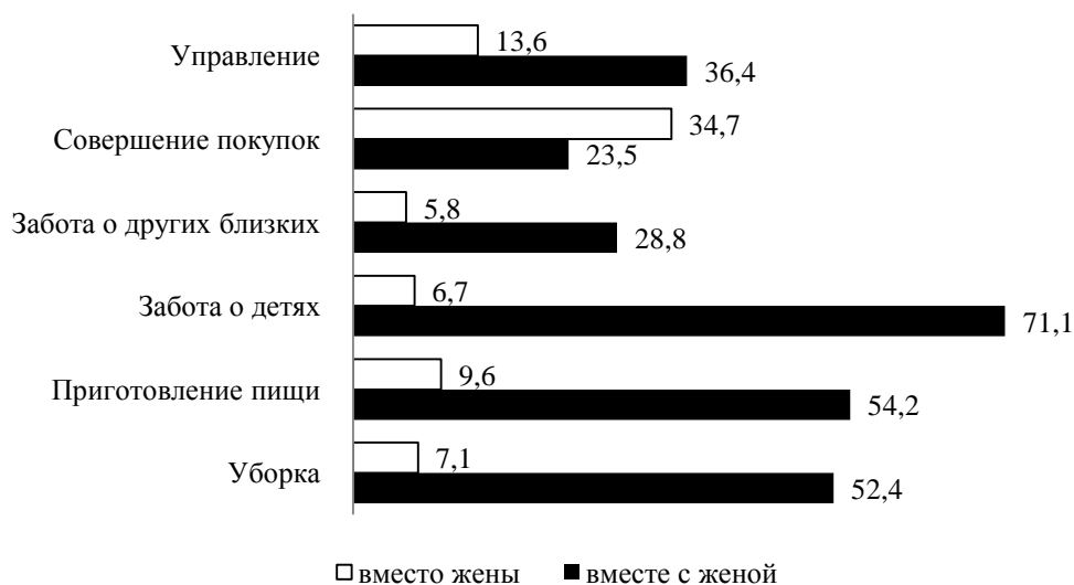
Рис. 2. Характер участия мужей респонденток в ведении домашнего хозяйства и уходе за близкими в условиях самоизоляции, % (N = 347)

Второе место по влиянию на переход к дистанционному режиму в период пандемии занимает наличие у женщины опыта удаленной работы (у семейных пар с детьми эта корреляция выше).