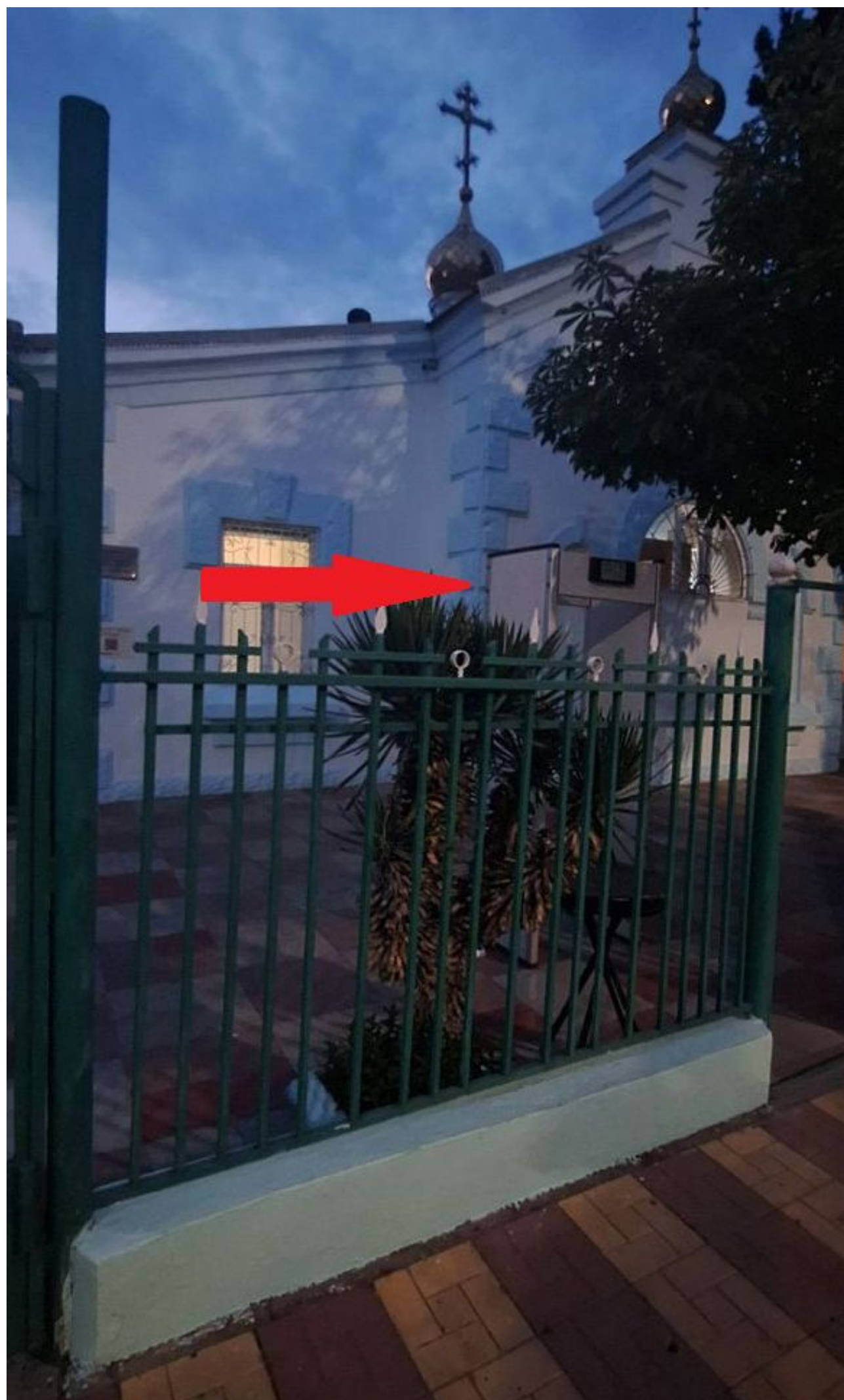
Металлоискатель при входе в Покровскую церковь г. Дербент (май 2024 года).