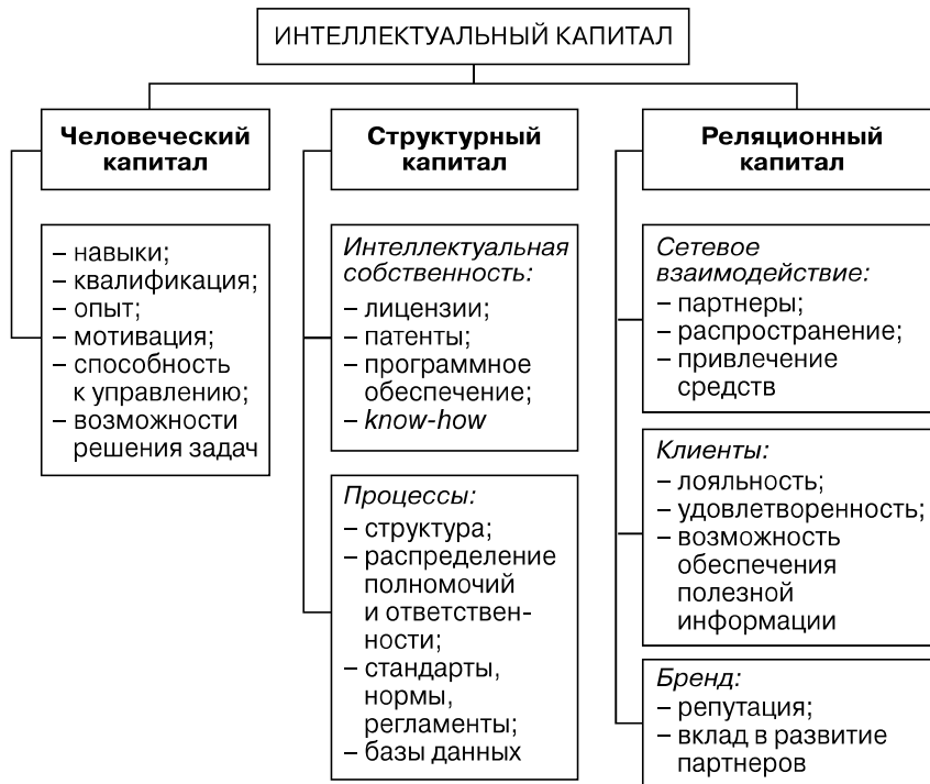
Рис. 1.1. Структура интеллектуального капитала организации