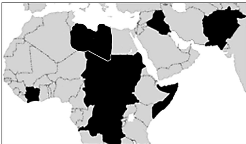
Рис. 2. Карта недееспособных государств (failed states)

Неудивительно, что в рейтингах недееспособности государств мира африканские страны стабильно занимают первые места (Fragile... 2015) (Рис. 2). Условия для системного кризиса могут сложиться, когда уровень техники и технологии (особенно военной) намного превышает уровень государственности. Это еще одна из причин формирования слабых или недееспособных государств.