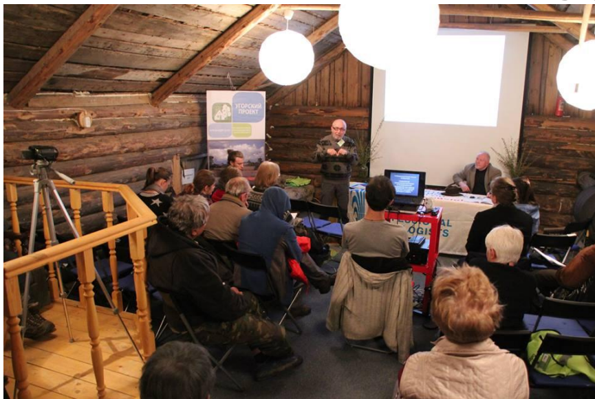
В зале заседаний. Лекцию читает проф.В.И.Ильин

Для конкурса студенческих экспедиций «Открываем Россию заново» 13 марта 2017 г.