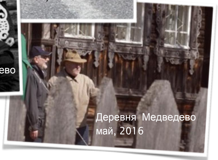
Деревня Медведево май, 2016