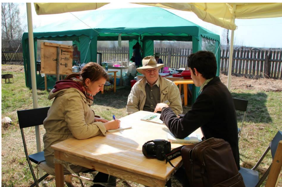
Интервью для прессы