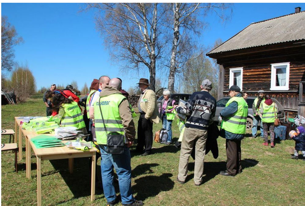
Идет регистрация участников, 2015 г.