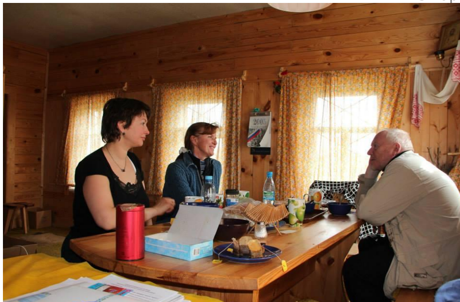
Беседа по душам. Штабной компаунд