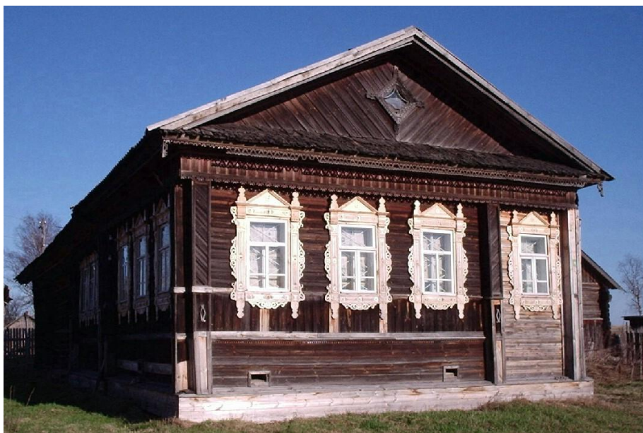
Штаб-квартира экспедиции в д.Медведево