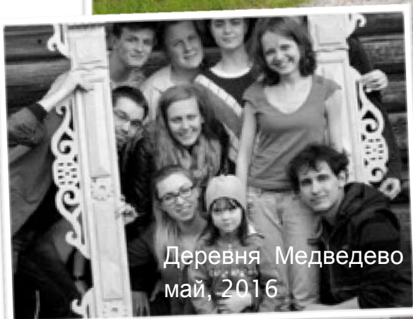
Деревня Медведево май, 2016