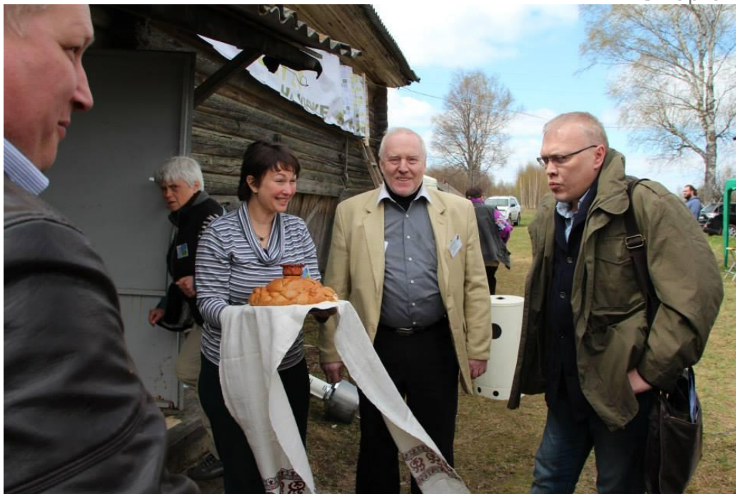
На молодежную встречу прибыл вице-губернатор Костромской области А.В.Соколов