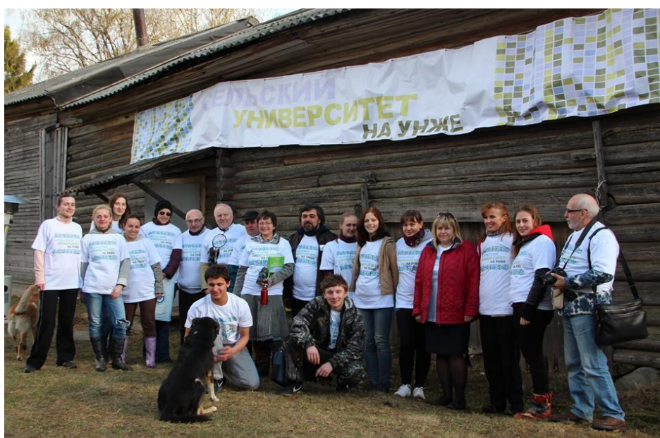
Сельский университет на Унже 2014 г.

Лекционные занятия, ежедневное подведение итогов, обсуждение научных тем будут проходить на Научной, экспедиционной и конференц-базе в д.Медведево.