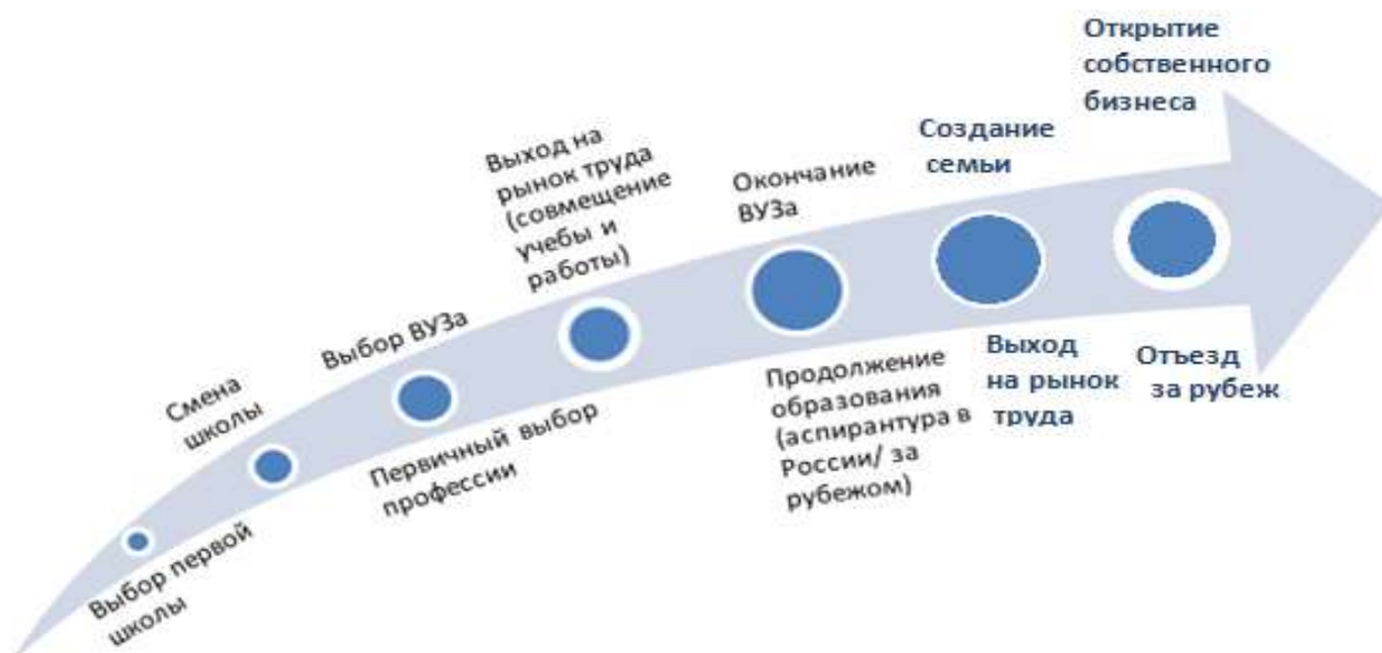
Рисунок 1. Пример точек выбора на жизненной траектории одаренного ребенка

Выборы в описанных точках формировали траекторию образовательной, профессиональной и, в конце концов, жизненной карьеры и представляли для настоящего исследования особый интерес. Очевидно, что сделанные определенным образом выборы могли привести актора в различные профессиональные группы, позволили достичь различных профессиональных статусов, и, в том числе, за рубежом. По ходу реализации сценария индивидом в него вносились корректировки и изменения, обусловленные успешностью выполнения предыдущих этапов.