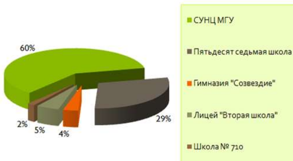
Рисунок 1. Распределение респондентов по школам

Отбор школ для проведения опросов осуществлялся на основании экспертных выводов о том, какие московские школы наиболее успешно реализуют образовательные программы интересующего вида. В выборочную совокупность вошли следующие школы (рис. 1):